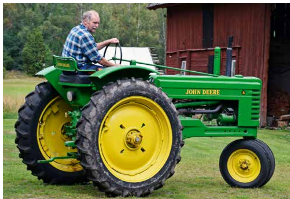
Sammanställda framhjul var inte så vanligt i Sverige, men däremot i Nordamerika. Det ger en utomordentligt bra svängradie.