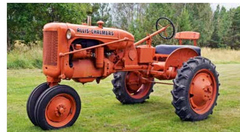
Just en Allis-Chalmers modell B med sammanställda framhjul hade Helges pappa en gång i tiden. Nu har Helge en sådan också.