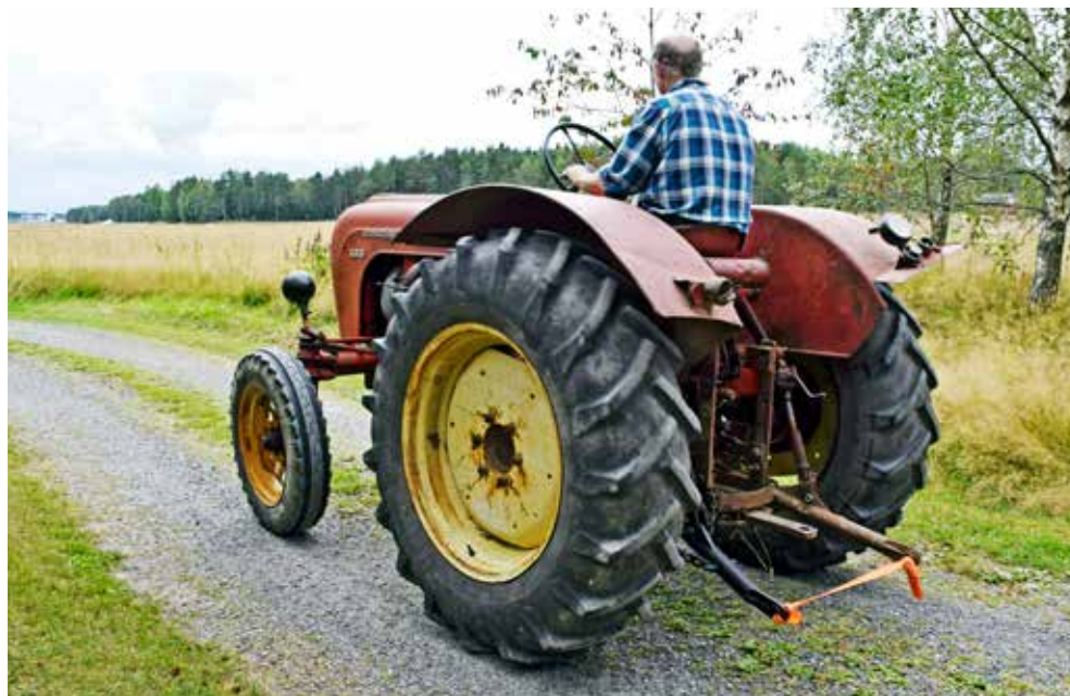
Porschen stod på en loge i över 30 år men startade direkt när Helge hämtade den inte långt hemifrån för 7-8 år sedan.