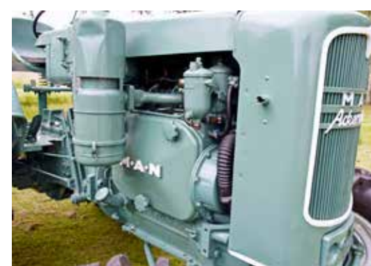
Bränslepumpen sitter gömd bakom skyddskåpan vid sidan av motorn. Ackerdiesel som det står på kylarmaskeringen betyder jordbruksdiesel.