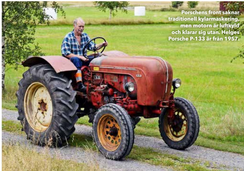
Porschens front saknar traditionell kylarmaskering, men motorn är luftkyld och klarar sig utan. Helges Porsche P-133 är från 1957.