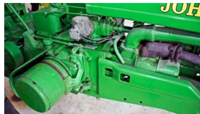
Kopplingen sköts för hand med en spak på John Deere av denna modell. Motorn är en liggande tvåcylindrig på nästan tre liters cylindervolym.