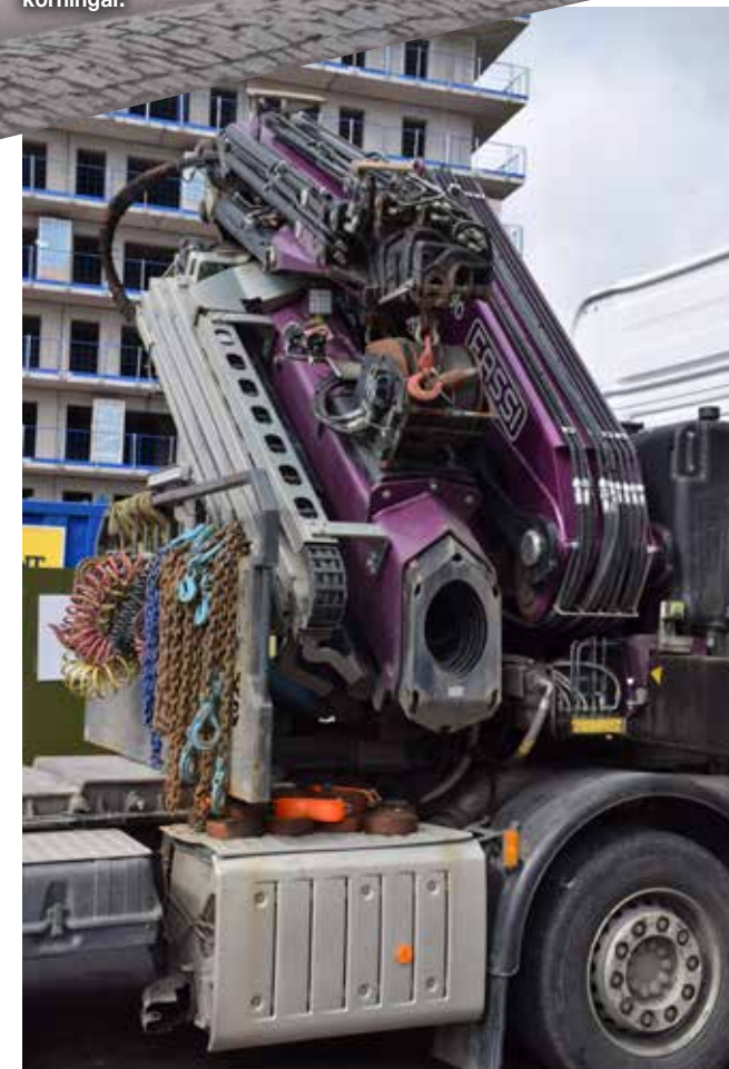
En Fassi F990.2.28/L616 blir en rejäl klump när den vikts ihop. Vikten ligger på närmare tio ton så en extra framaxel är verkligen på sin plats.