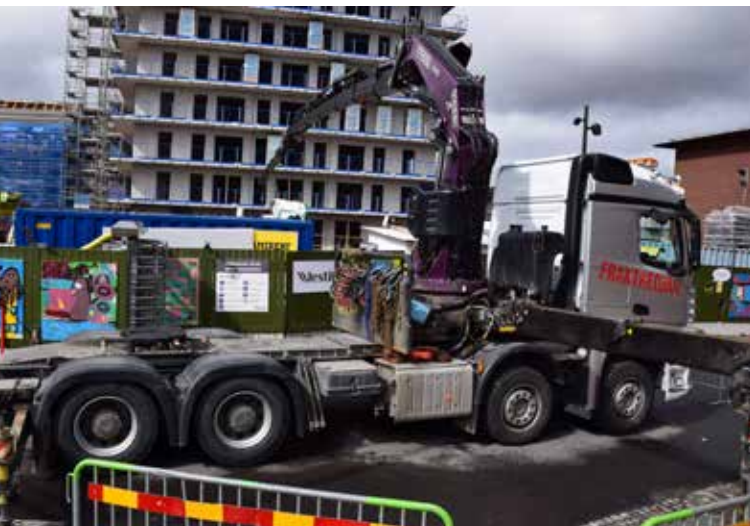
Vi snackar här kranbil med vändskiva, men bilen har Laxo snabbblås och på fem minuter förses den med lastflak när behovet finns.