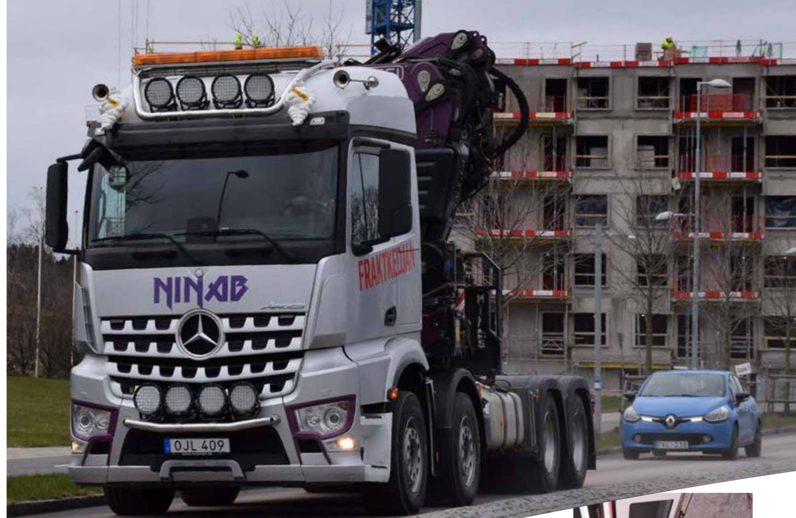
Ninabs Mercedes Arocs 3251 från 2016 har bara gått 14.000 mil. Det blir inte så många mil på den här typen av körningar.

Hemma i Lödöse är han inte förrän under helgen. Men det är livet för en kranbilschaufför med skiftande uppdrag. □