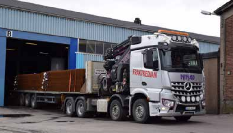
Lasten med 21 ton armeringsmattor är redo för att transporteras de 25 milen till Skänninge där kriminalvårdsanstalten ska byggas ut.