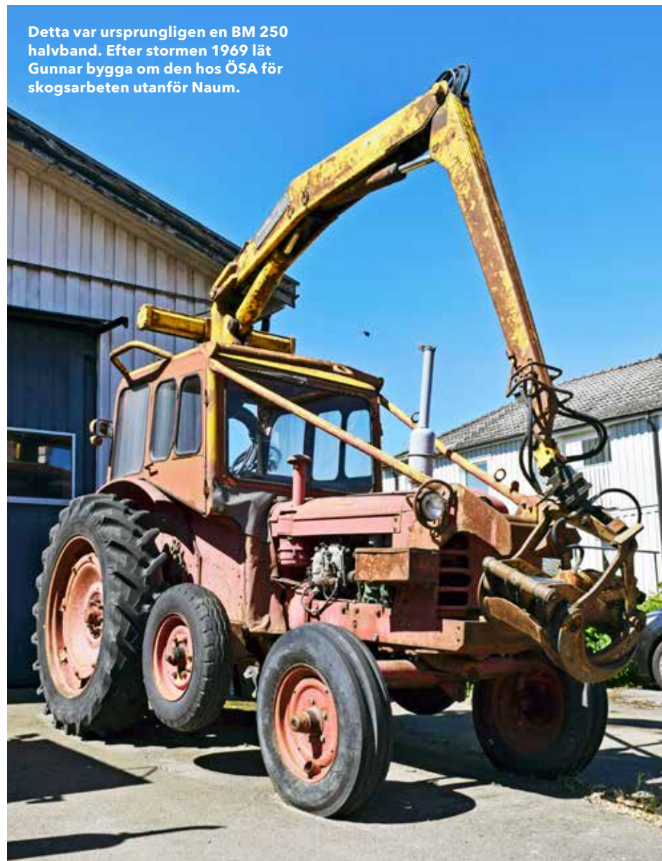
Detta var ursprungligen en BM 250 halvband. Efter stormen 1969 lät Gunnar bygga om den hos ÖSA för skogsarbeten utanför Naum.

► Inte minst så behövdes en ordentlig vagnpark på båda gårdarna.