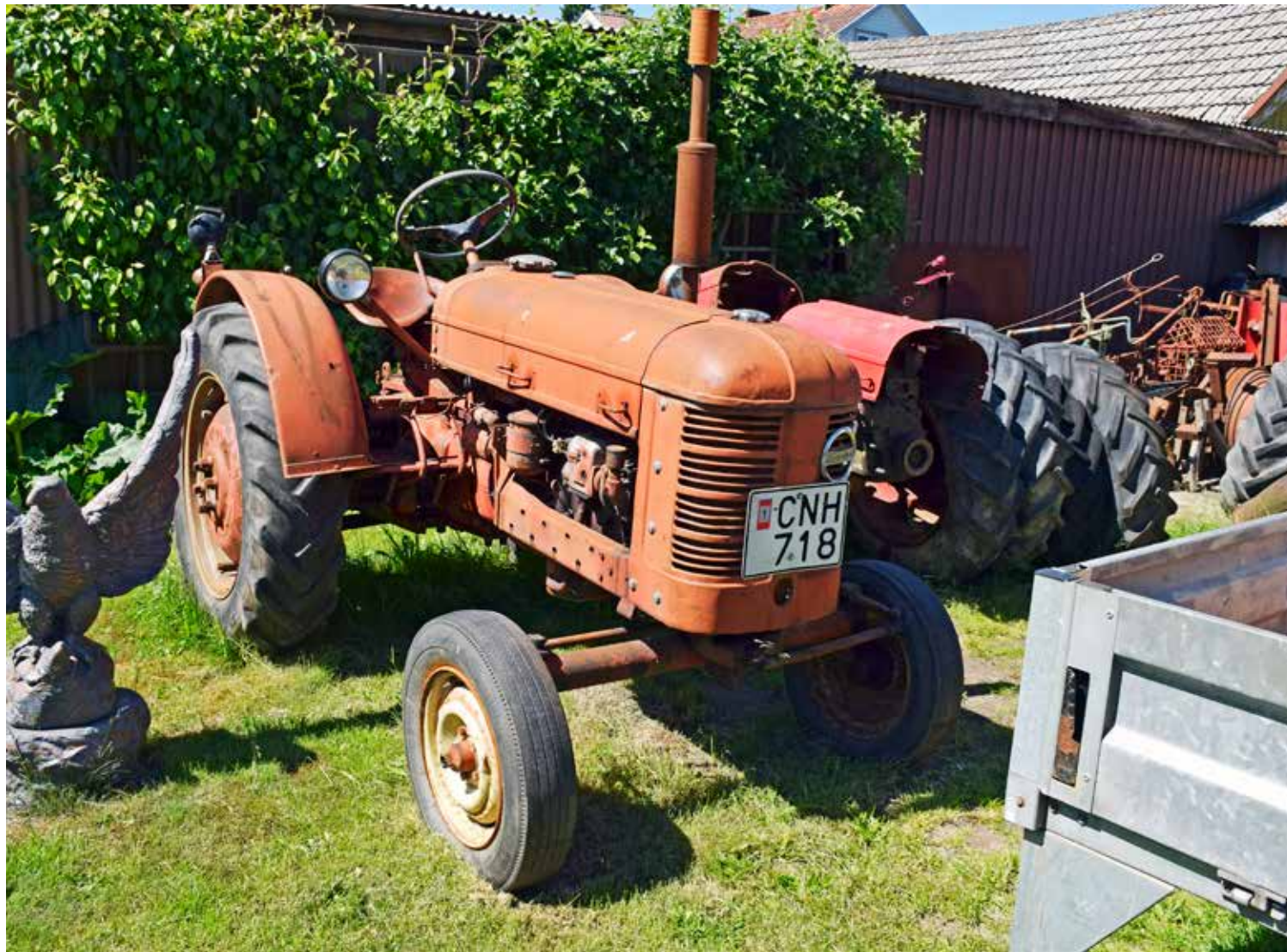
Förra året tillkom i samlingen en Volvo T 22 från 1951. Den syns i bakgrunden. Som donatortraktor köptes denna T 21 från 1952. Tveksamt är om den kommer att plockas ner.