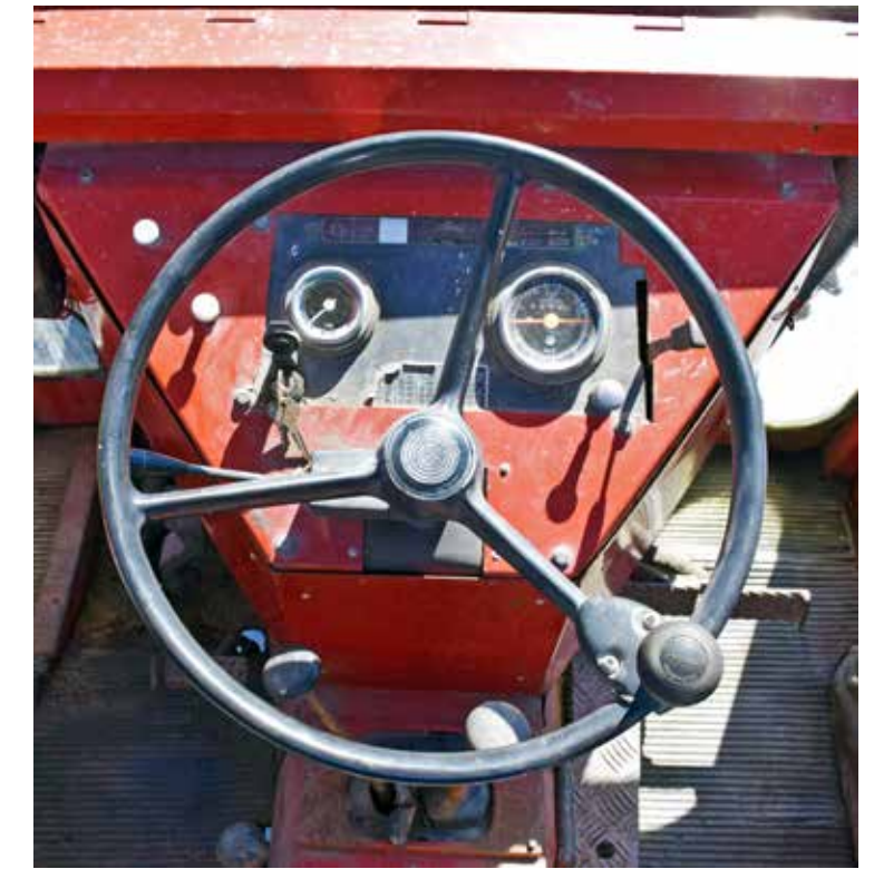
Så hemskt avancerat var det inte kring förarplatsen i en Steyr från mitten av 70-talet. Temperaturmätare, timmätare och en rad kontrollampor.