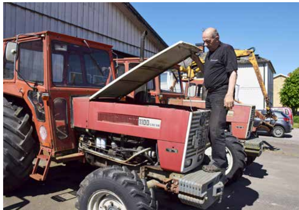
Under motorhuvu på Steyr 1100 sitter Steyrs egna WD-610.40-motorn på närmare sex liters cylindervolym och 98 hästkrafter.

”Redan som 10-12-åring satte pappa upp mig på hans Volvo T 31. Han sa att man måste tänka sig för och inte ha för bråttom.”