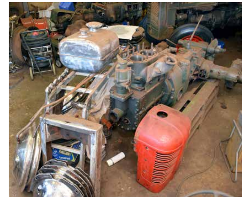
Två av de fem BM 10-kropparna är tidiga med tanken på vänster sida. De ligger långt upp i prioritet på verkstadens renoveringslista.