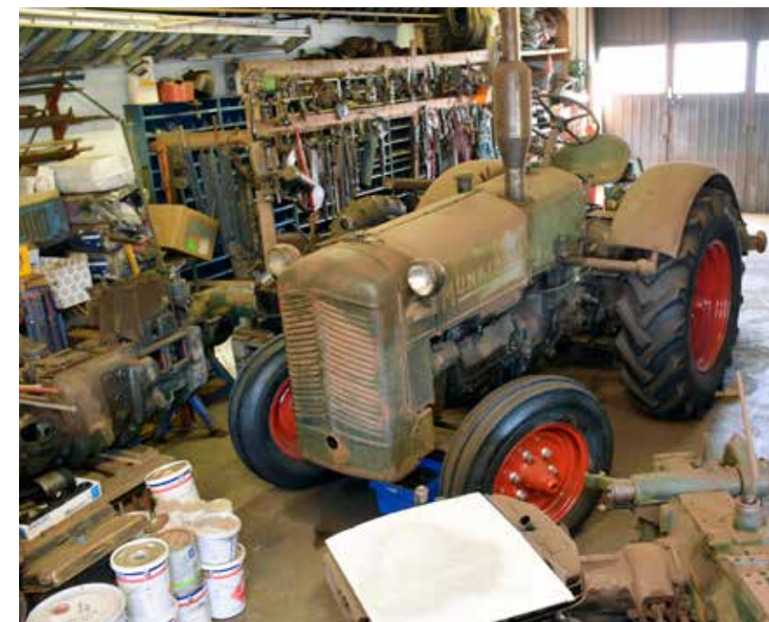
I verkstaden står en BM 20 från 1950 som Ingvar köpte från Viksta Traktormuseum ovanför Uppsala. I dagsläget saknas bara några rör till tryckluftstarten.