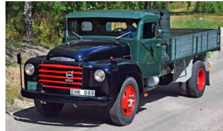
Starke kom i folkmun att bli samlingsnamnet för den medeltunga serie från Volvo som delade utseende. Just L375 tillverkades mellan åren 1955 och 1961.