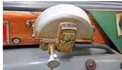
Några försök att bygga in vakuomtorkarmotorn gjordes inte på Starken. Behovet och ibland utrymmet fanns inte alltid på den tiden.