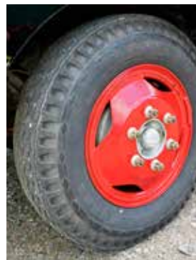
Däcken på Starken ser ut att hängt med länge men har mycket kvar att ge. 8.25-20 diagonaldäck från Good Year med de karaktäristiska romberna.