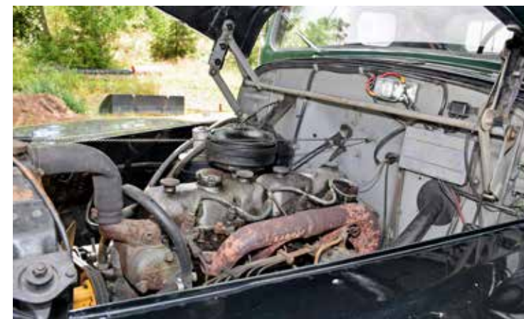
Volvos nya D47 A-motor bjöd på 90 hk, senare 95 hk. Cylindervolymen var 4,7 liter, lika mycket som bensinvarianten A6.