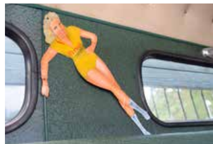
Veedolpinuppan har tidigare suttit i fronten på Starken, men på grund av stöldriskan får den sitta på bakväggen.