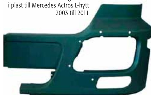
STÖTFÅNGARE Stötfångarhalva i plast till Mercedes Actros L-hytt 2003 till 2011