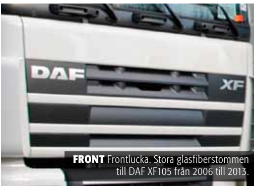
FRONT Frontlucka. Stora glasfiberstommen till DAF XF105 från 2006 till 2013.