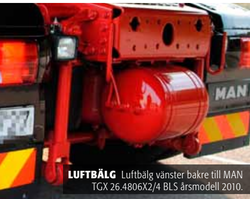
LUFTBÄLG Luftbälg vänster bakre till MAN TGX 26.480X2/4 BLS årsmodell 2010.