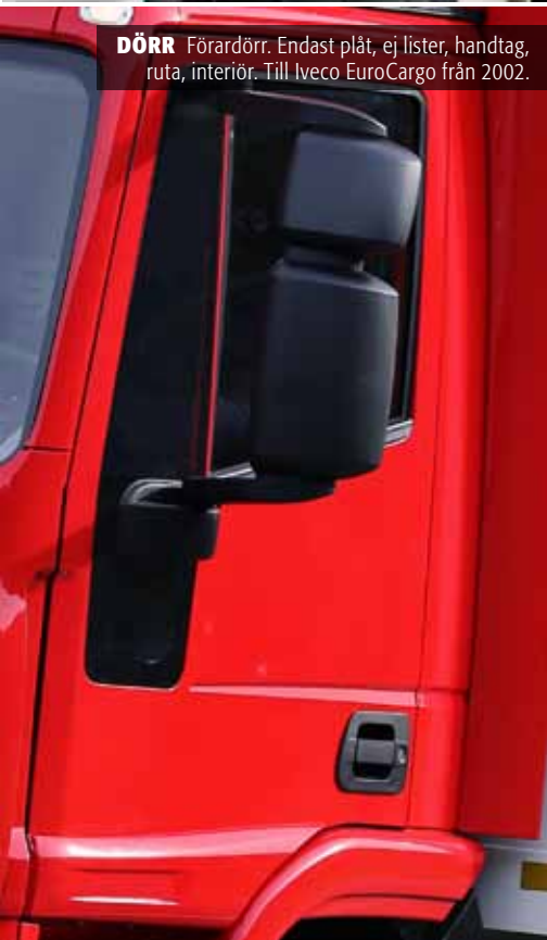
DÖRR Förardörr. Endast plåt, ej lister, handtag, ruta, interiör. Till Iveco EuroCargo från 2002.