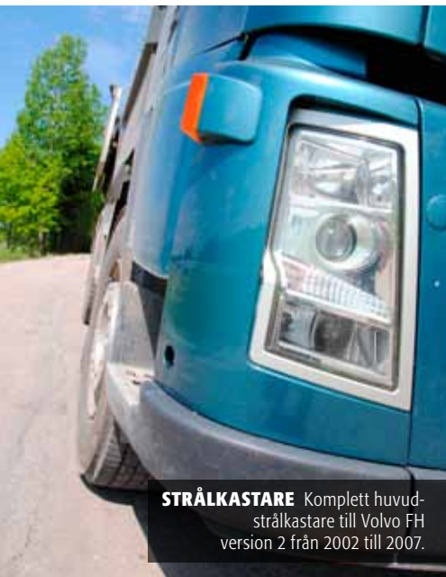
STRÅLKASTARE Kompletta huvudstrålkastare till Volvo FH version 2 från 2002 till 2007.