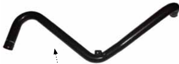
MER ÄN FYRA GÅNGER SÅ DYR