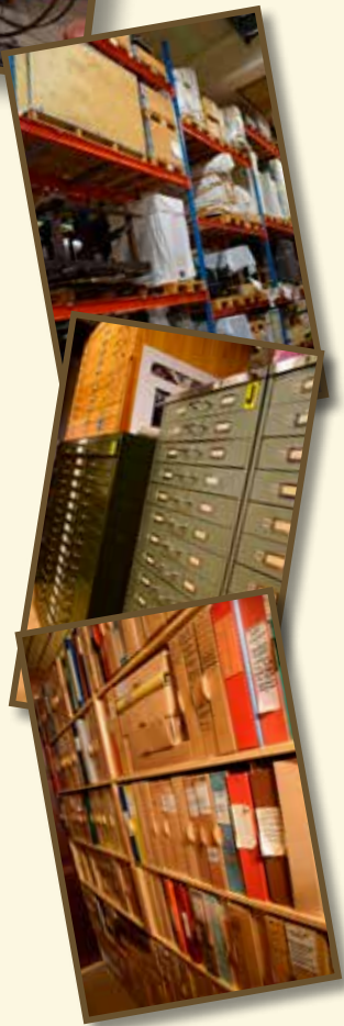
Fotnot: I Göteborg finns nu rätt långt gångna planer på att till 2019 bygga ett varvs- och industrihistoriskt centrum på Lindholmen, inte långt från de nuvarande lokalerna.