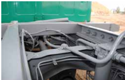
Dubbelramen har klarat sig utan att svälla på grund av rost vilket annars mer är regel än undantag på äldre Scanior.