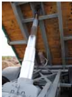
Trevägstippen är tillverkad av Blidsberg. Hydraulkolven packade Håkan om och en kolvsektion fick omkromas.